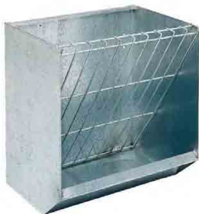
Forrajera individual para ovejas

Cod. 50509 - Parrilla de varilla calibrada electrosoldada. Medidas: Largo 200; ancho 36; alto 54.