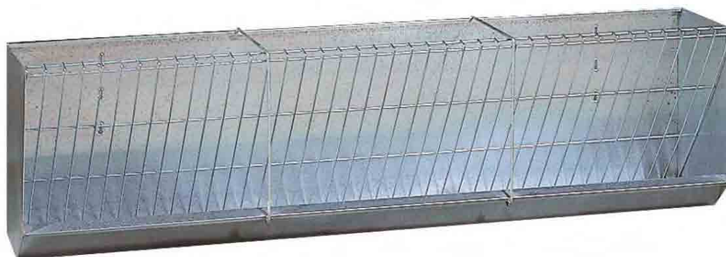
Forrajera de pared modelo 78

Cod. 50509 - Parrilla de varilla calibrada electrosoldada. Medidas: Largo 200; ancho 36; alto 54.