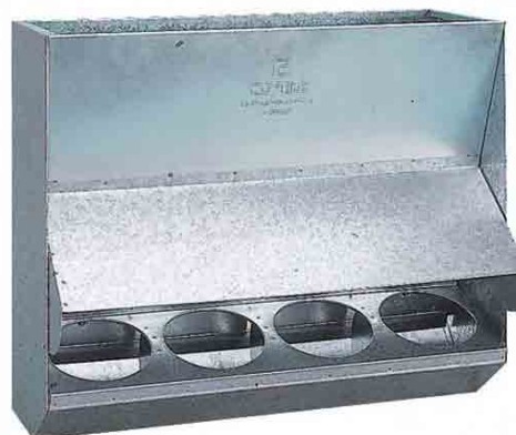
Tolva para arranque de corderos

Cod. 50530 - Parrilla de varilla electrosoldada con respaldo. Medidas: Largo 50; ancho 36; alto 54.